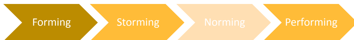
Figur 1. Modell för att arbeta i team inspirerad av, Tuckman. (1965, s.396)

konfronteras med olika åsikter och viljor och varandras personligheter. Norming är den tredje fasen då normer och regler har etablerats och rollerna är klargjorda. Norming fasen är då medlemmarna lär sig försöka lösa problem med varandra och accepterat varandras åsikter och idéer och kompromissat och försöker anpassa sig till dem. Performing är den sista fasen då allt börjar lösa sig. Roller och strukturen i teamet blir klarare och samarbetet börjar löpa bättre. Samarbetet blir flexiblere och funktionellt och energin i gruppen blir positivare. (Tuckman. 1965, s.396).