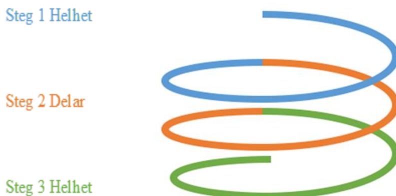
Figur 2. Den hermeneutiska bearbetningsprocessen

Nedan presenteras en figur (figur 2) som tydliggör sambandet mellan de olika stegen. I steg 1 studeras helheten, och den för förståelsen vidare till steg 2 där delarna studeras, vilket leder processen vidare till steg 3 där helheten studeras igen.