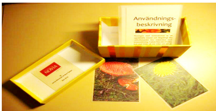
BILD 1. Minneskort

Övningarna kan även göras i grupp vilket främjar den enskildes självkänsla positivt och detta i sin tur minskar stress och ångest. Detta kan leda till minskat behov av vård, vilket är syftet med resursförstärkande arbetssätt. Målet med examensarbetet är viktigt eftersom det främjar hälsa och i dagens läge är det mycket centralt att arbeta mångprofessionellt och resursförstärkande.