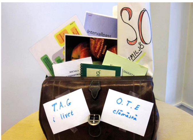
BILD 7. Produkterna på väg till beställarna.

Den mångprofessionella profilen upplevdes mycket bra i projektet. Studerandena uppskattade att i handledningsgruppen fanns socionom-, sjukskötare- och hälsovårdarstuderande. Den mångprofessionella profilen bidrog till en bredare syn vilket i sin tur aktiverade diskussionen. Den mångprofessionella profilen förverkligades genom grupphandledning, seminarier och genom läsandet av andras texter. Många studerande upplevde att handledningen fungerade bra och handledningen i mindre grupper upplevdes positivt.