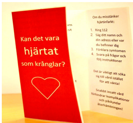
BILD 3. Informationskort