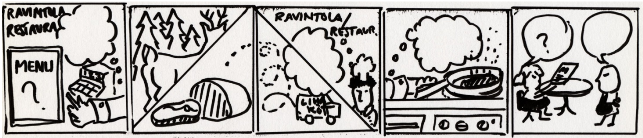
Figur 1: Enkätens tecknade serie. Fyll i text...